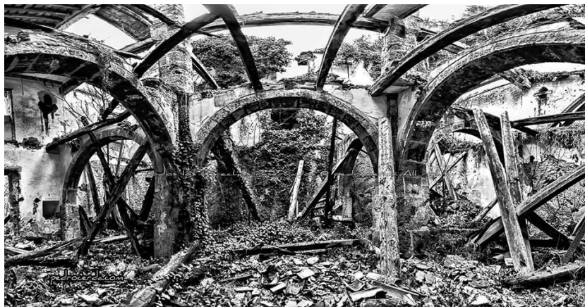
Imagen de la Central Eléctrica del Salto en la actualidad

¡Cómo nos gustaría que algunas publicaciones “oficiales, o no”, presentaran similar garantía de seriedad en el trabajo!